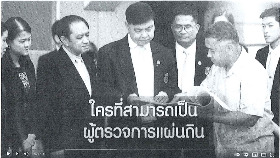
วีดิทัศน์แนะนำหน้าที่และอำนาจของผู้ตรวจการแผ่นดิน ตามรัฐธรรมนูญแห่งราชอาณาจักรไทย 2560 (02-2564)