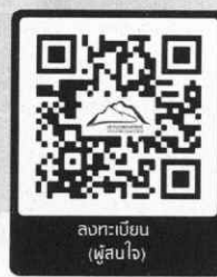
ลงทะเบียน (ผู้สนใจ)