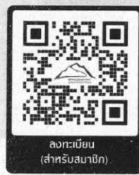
ลงทะเบียน (สำหรับสมาชิก)

Meeting ID : 819 4038 1080 Password : 240964