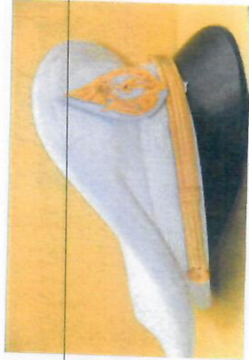
ด้านข้างหมวก