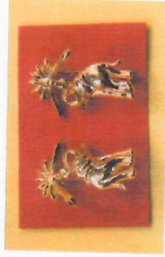
เข็มกลัด ติดปกคอเสื้อ

เครื่องหมายประดับเครื่องแบบ พันโทหญิงมหาวิทยาลัย มหาวิทยาลัยเชียงใหม่