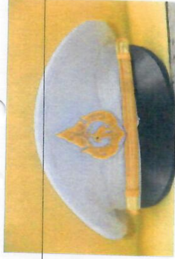
ด้านหลังหมวก