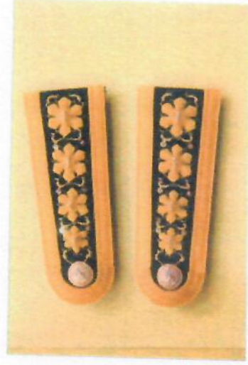
อินทราหนู