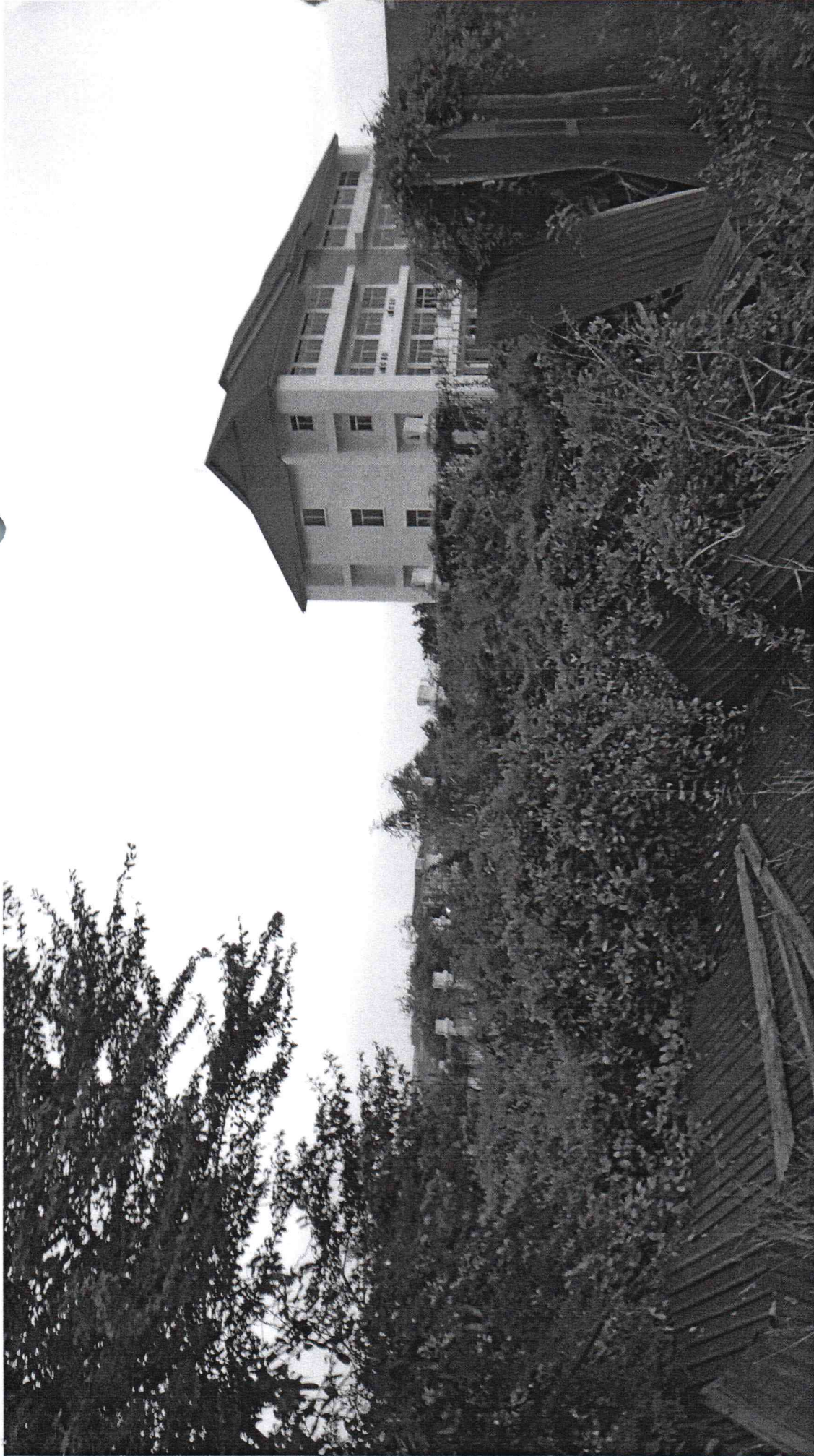
ภาพที่ 1 แสดงบริเวณที่จะทำการก่อสร้างหอพักให้กับนักศึกษาสาขา MPT ที่จะเดินทางไปศึกษา ณ MARITIME