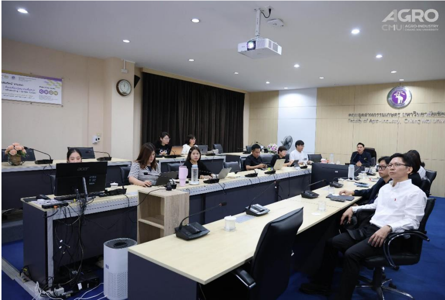
ข่าวกิจกรรม ที่ลิงค์ https://www.agro.cmu.ac.th/th/news/3637