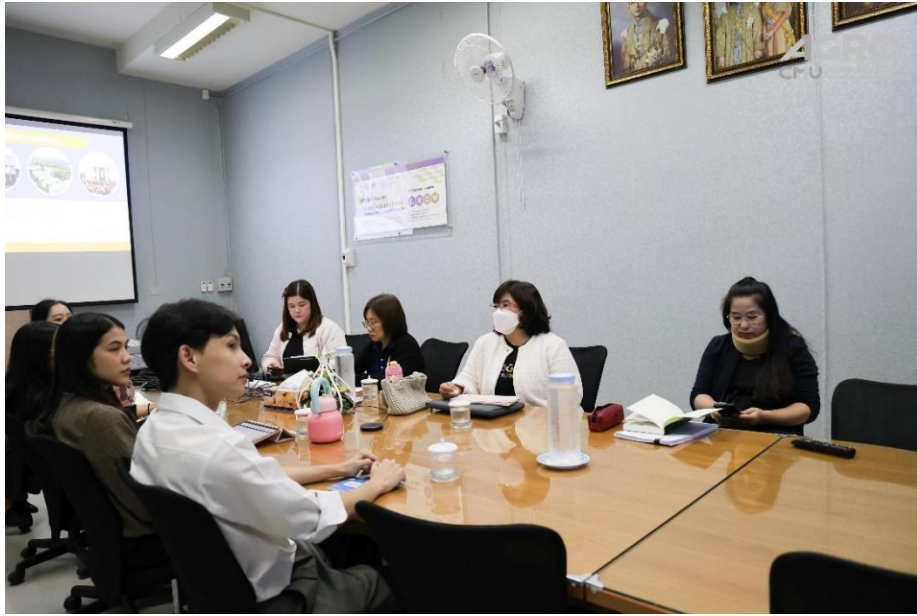
ข่าวกิจกรรม ที่ลิงค์ https://www.agro.cmu.ac.th/th/news/3598