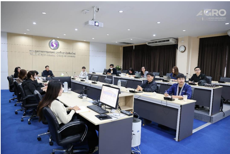
ข่าวกิจกรรม ที่ลิงค์ https://www.agro.cmu.ac.th/th/news/3566