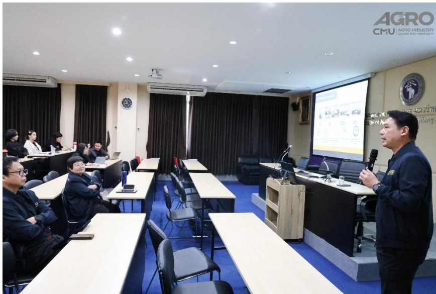
ข่าวกิจกรรม ที่ลิงค์ https://www.agro.cmu.ac.th/th/news/3498