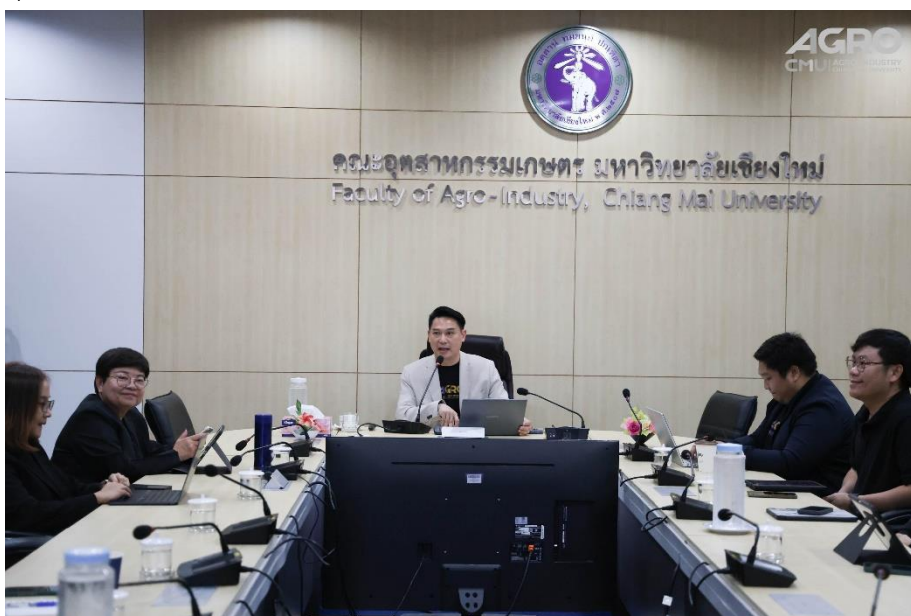
ข่าวกิจกรรม ที่ลิงค์ https://www.agro.cmu.ac.th/th/news/3636