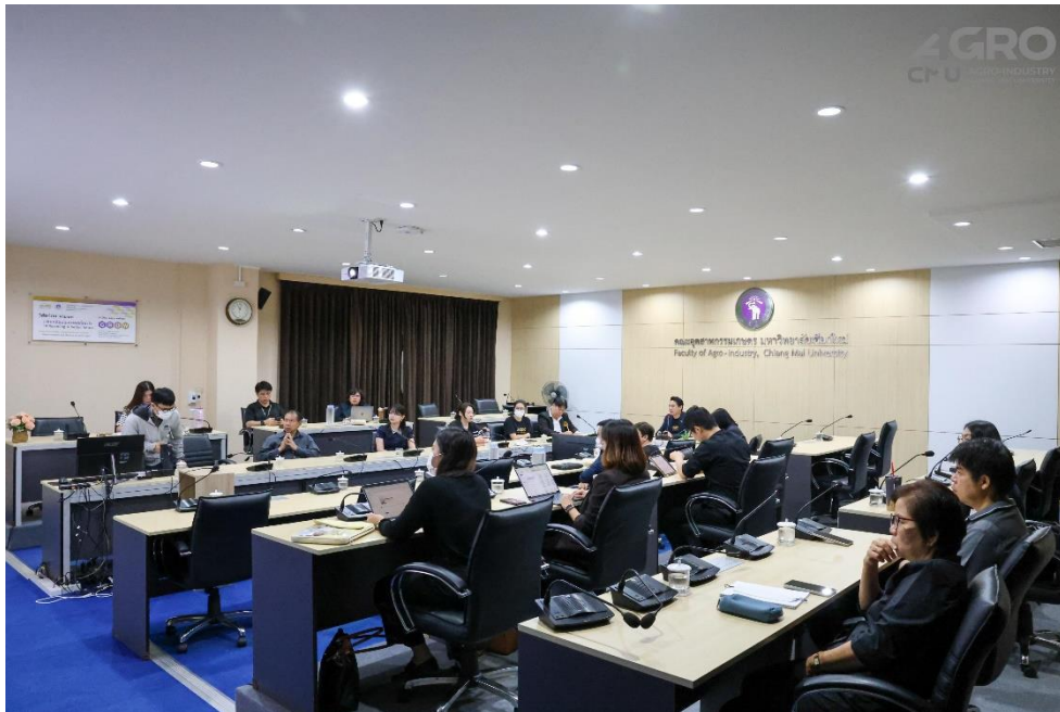
ข่าวกิจกรรม ที่ลิงค์ https://www.agro.cmu.ac.th/th/news/3526