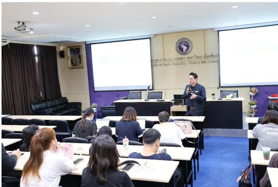
ข่าวกิจกรรม ที่ลิงค์ https://www.agro.cmu.ac.th/th/news/3525