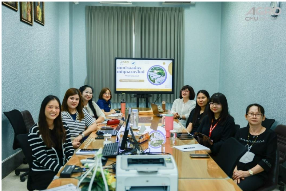
ข่าวกิจกรรม ที่ลิงค์ https://www.agro.cmu.ac.th/th/news/3738