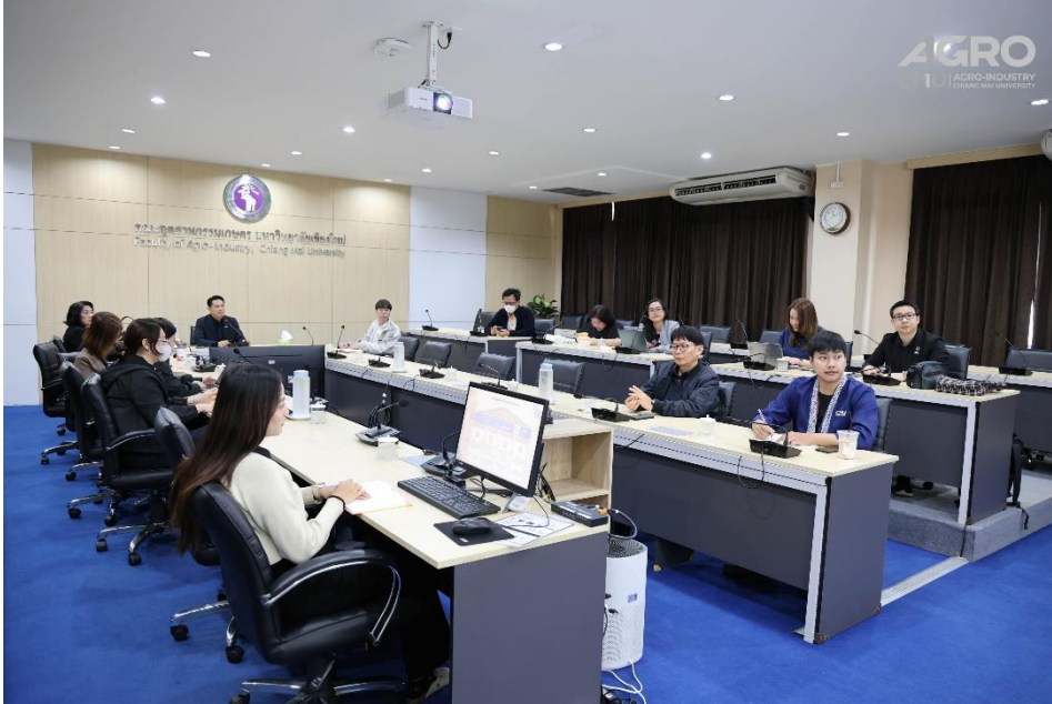
ข่าวกิจกรรม ที่ลิงค์ https://www.agro.cmu.ac.th/th/news/3566