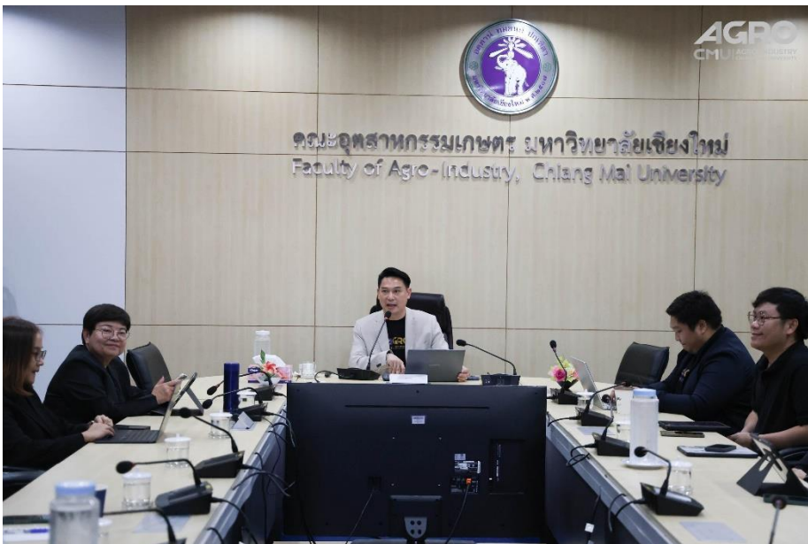
ข่าวกิจกรรม ที่ลิงค์ https://www.agro.cmu.ac.th/th/news/3636