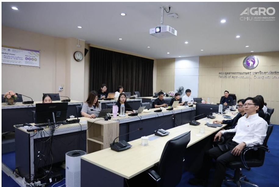
ข่าวกิจกรรม ที่ลิงค์ https://www.agro.cmu.ac.th/th/news/3637