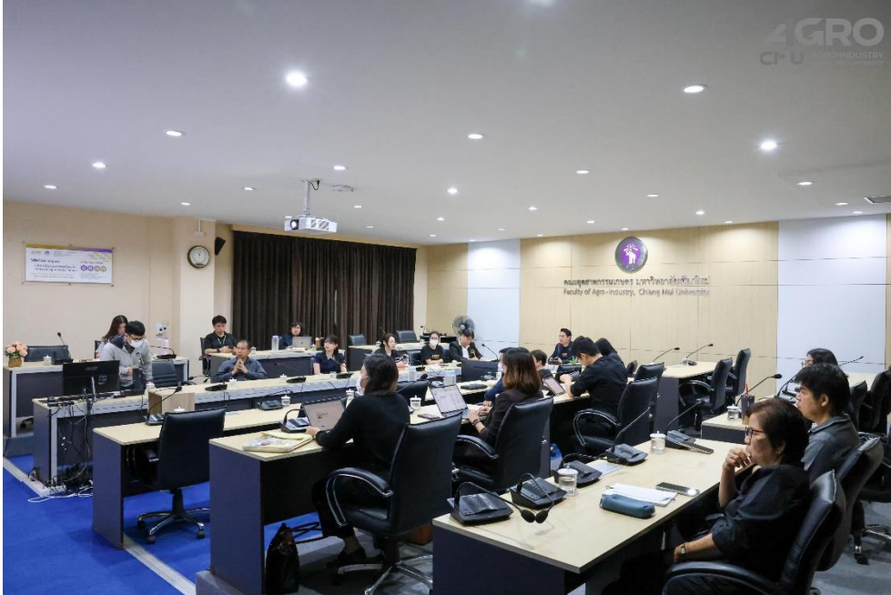
ข่าวกิจกรรม ที่ลิงค์ https://www.agro.cmu.ac.th/th/news/3526