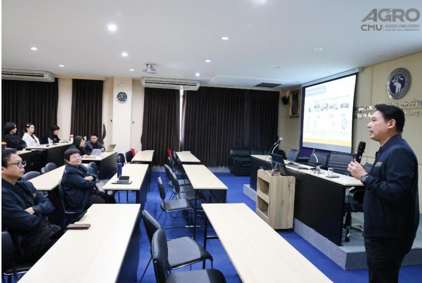
ข่าวกิจกรรม ที่ลิงค์ https://www.agro.cmu.ac.th/th/news/3498