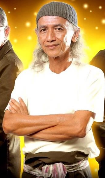
พิทิต์พิทิต์ มีสมสืบ ศิลปินแห่งชาติ สาขาวรรณศิลป์ ปีพ.ศ.๒๕๕๙ สร้างสรรค์งานกวี