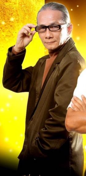
เสนีย์ แอ้มเค็ช ศิลปินแห่งลุ่มน้ำเจ้าพระยา สาขาทัศนศิลป์ สร้างสรรค์งานศิลป์