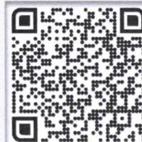
กรณีเสนอชื่อ