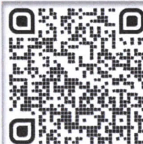
กรณีสมัครด้วยตนเอง