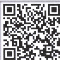
ดาวน์โหลดประกาศ