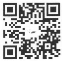
ประกาศสรรหาฯ

กองบริหารทรัพยากรบุคคล โทร. ๐ ๒๒๘๐ ๐๐๙๑-๖ ต่อ ๔๑๔๗ โทรสาร ๐ ๒๒๘๐ ๔๑๖๒