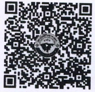
ประกาศรับสมัคร

กลุ่มงานการเจ้าหน้าที่ สำนักงานเลขานุการกรม โทร. ๐ ๒๑๔๒ ๓๔๘๔ โทรสาร ๐ ๒๑๔๓ ๙๐๖๙