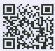
ช่องทางการรับสมัคร

กองนโยบายป้องกันและบรรเทาสาธารณภัย ส่วนนโยบายและยุทธศาสตร์