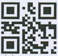
สิ่งที่ส่งมาด้วย ๑ - ๓