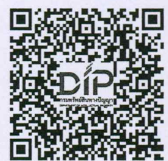
ประกาศรับสมัคร