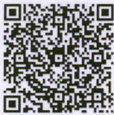
QR code ลงทะเบียน

จึงเรียนมาเพื่อโปรดพิจารณาส่งบุคลากรเข้ารับการอบรมและขอความอนุเคราะห์ประชาสัมพันธ์ให้บุคลากร ในหน่วยงานของท่านทราบต่อไปด้วย จะขอบคุณยิ่ง