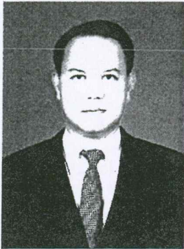
๑๑. พันตำรวจเอก มนัส นครศรี อดีตรองผู้บังคับการอำนวยการ กองบัญชาการตำรวจภูธรภาค ๑