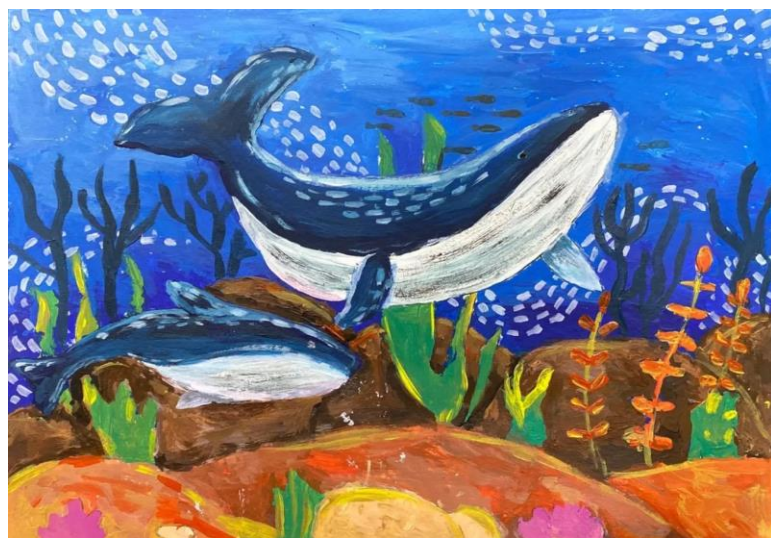
รางวัลผลงานยอดเยี่ยมที่สุดในช่วงอายุ ๔ - ๖ ปี (Best in Ages 4-6) เด็กชายพุฒิภัทร สกลดิลก อายุ ๖ ปี สถาบันสอนศิลปะ Little Art Chonburi จังหวัดชลบุรี ชื่อผลงาน “Whales”