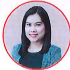
พศ.ดร.อรอมล อาระพล