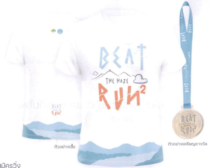
ตัวอย่างเสื้อ