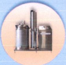
HI-YIELD ESSENTIAL OIL DISTILLER