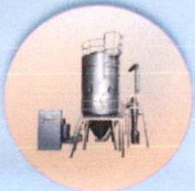
HI-YIELD SPRAY DRYER

พบกับวิทยากรผู้เชี่ยวชาญ ด้านเทคโนโลยีการแปรรูป